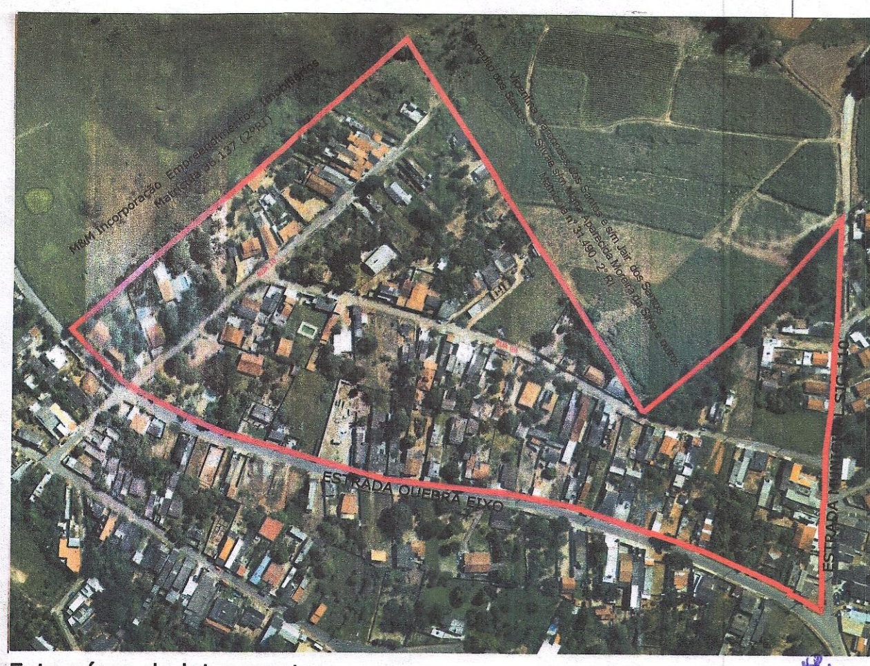
Foto aérea do loteamento

PREFEITURA DE SÃO JOSÉ DOS CAMPOS SECRETARIA DE GESTÃO HABITACIONAL E OBRAS DEPARTAMENTO DE REGULARIZAÇÃO FUNDIÁRIA