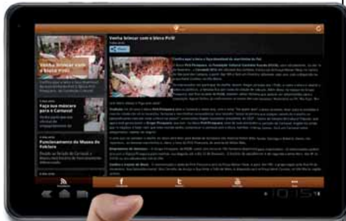
Imagem meramente ilustrativa da versão no tablet