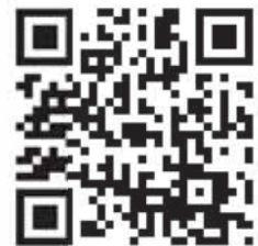
QR CODE que te leva direto para o site mobile da FCCR

Execute o aplicativo instalado em seu celular, posicione a câmera digital de maneira que o código seja escaneado. Em instantes, o programa vai redirecioná-lo para o site.