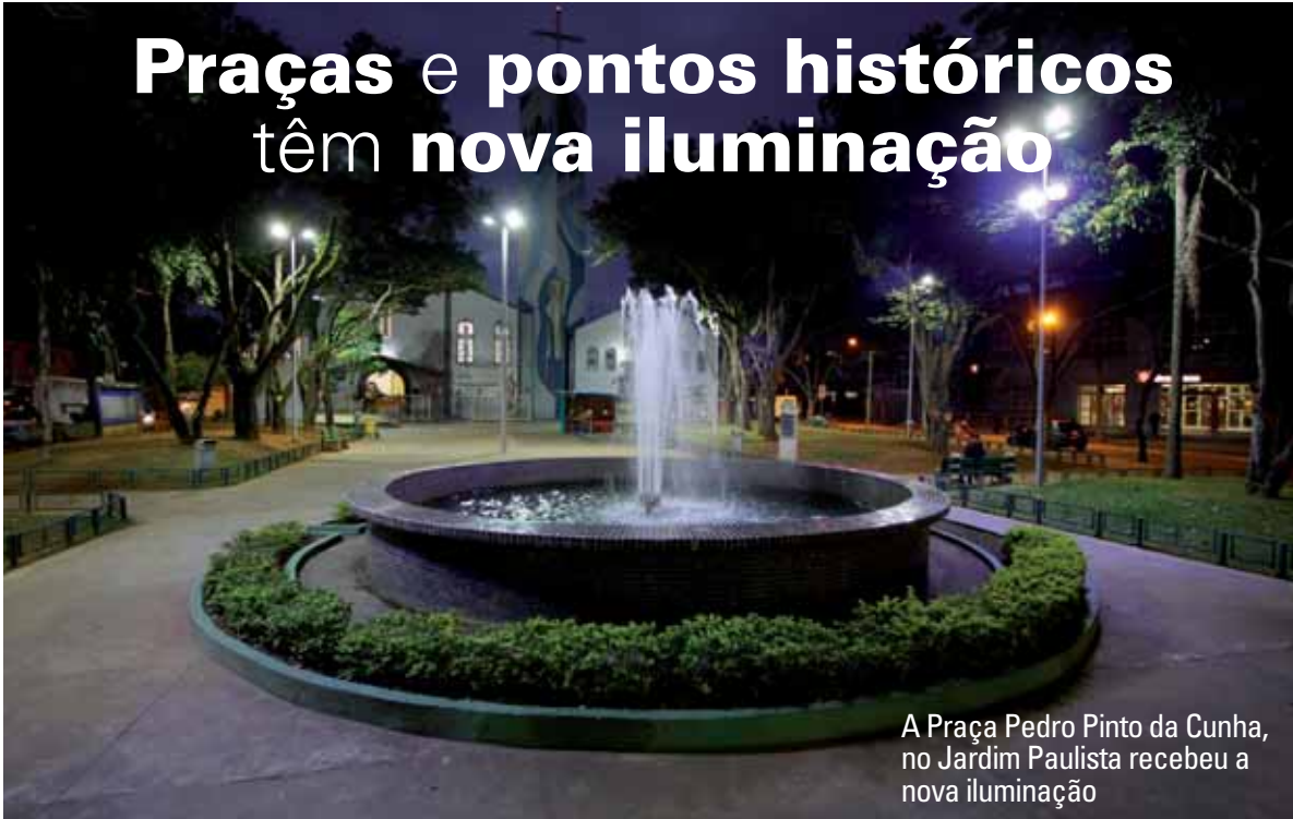
A Praça Pedro Pinto da Cunha, no Jardim Paulista recebeu a nova iluminação

Com o objetivo de melhorar a segurança e o conforto da população, a Prefeitura prossegue a revitalização na iluminação de praças, pontos históricos e vielas, em diversos locais públicos da cidade.