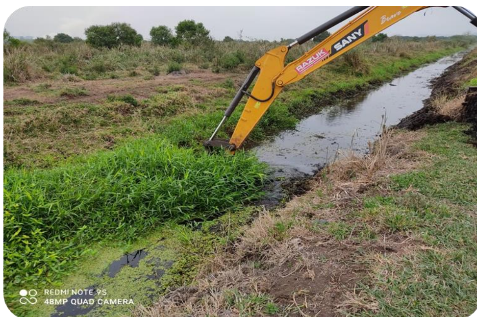
Figura 2 - Desassoreamento mecânico na Vala dos Verdureiros, Região Oeste de São José dos Campos.

Conforme ilustrado na Figura 2, o processo de desassoreamento consiste na retirada mecânica do material granular acumulado no leito do curso d'água e em sua deposição na própria margem ou em área de bota-fora adequada – a depender da situação in loco e tendo em vista a custo-efetividade do contrato.